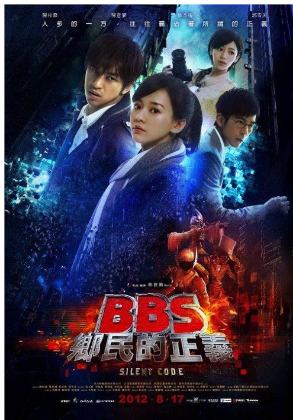
《BBS 鄉民的正義》大概是台灣第一部描述數位原民世界觀與網路霸凌之間關係的電影

其實，創造出另一個虛擬世界並不是網路世代的專利，諸如「共產國際」、「自由陣營」、「朝貢體系」、「大英國協」、「基督宗教」等，也都是肉眼看不見的概念，人們一樣是都透過對這些概念的「相信」去建構自己的世界觀，也會為了這些摸不到的概念自願犧牲性命，與數位原民對資訊符碼的重視並無二致 4 。